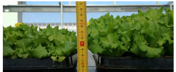
LETTUCE en pépinière traitée (à droite) LETTUCE en pépinière NON traitée (à gauche).

Une caractéristique importante est l'exclusion complète de l'utilisation de matrices organiques remontant à types de boues (épurateurs industriels, civils), déchets (taillants ménagers), fauchage ou élagage sur route.