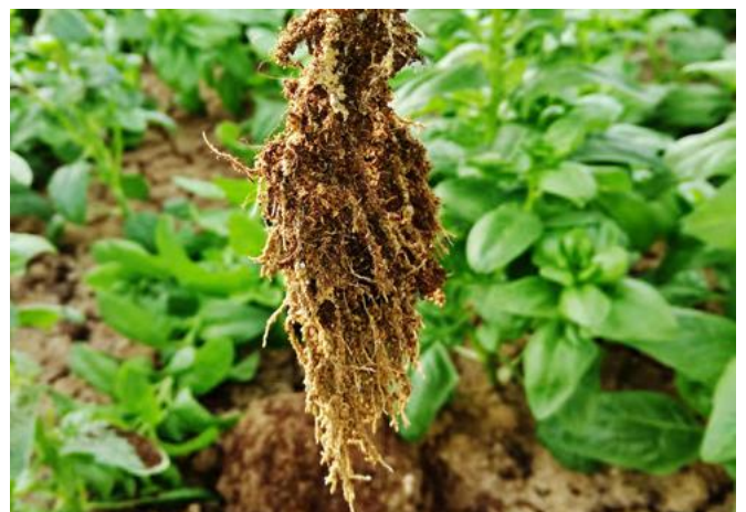
Développement de la racine d'épinard avec STARSOIL®

Une caractéristique importante est l'exclusion complète de l'utilisation de matrices organiques remontant à types de boues (épurateurs industriels, civils), déchets (taillants ménagers), fauchage ou élagage sur route.