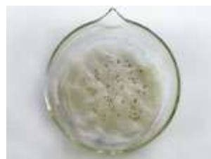
Preparazione letto di germinazione per verifica compatibilità.