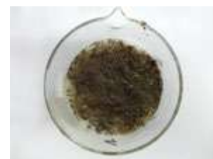
Aggiunta di FERTILHUMUS® ed incubazione per molte ore.